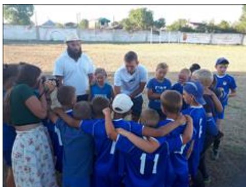
Установка перед игрой в футбол с командой тхеквондистов Добрались до лагеря, тренировочный процесс идет по плану.

Мероприятие: Занятия с ЦГ проекта по самбо, хоккею, футболу, тактике и психологической подготовке к соревнованиям