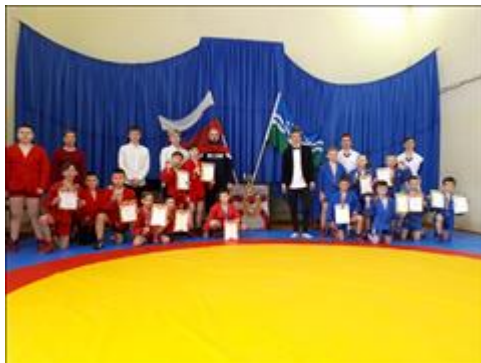
Фото победителей и призеров первого дня соревнований 8 представителей ЦГ проекта в новой, пошитой на заказ форме самбо (куртка и шорты)

Мероприятие: Приобретена (сшита на заказ) форма самбо, парадные костюмы для ЦГ проекта