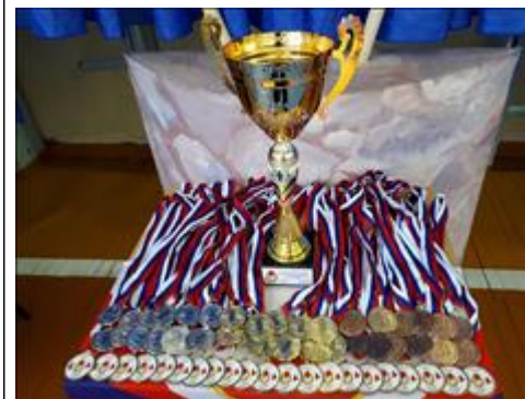
Кубок за 1 командное место и комплекты медалей Согласно положению за первое место команда получила кубок, победители и призеры награждены грамотами и медалями.