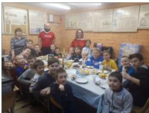
Отмечаем первый командный кубок с ЦГ проекта Собрались в классе зала борьбы самбо, проводим чаепитие.

Мероприятие: Приобретение билетов туда-обратно, оплата проживания и питания в летнем спортивном лагере на море для ЦГ проекта