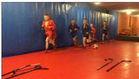
Разминка перед тренировкой самбо+хоккей в бросковой зоне До карантина проходили сдвоенные тренировки ковер+лед.

Мероприятие: Занятия с ЦГ проекта по самбо, хоккею, футболу, тактике и психологической подготовке к соревнованиям