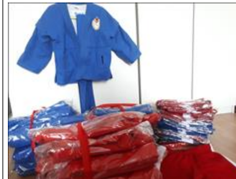
Форма самбо (куртки и шорты) Вновь полученные комплекты, только с производства.