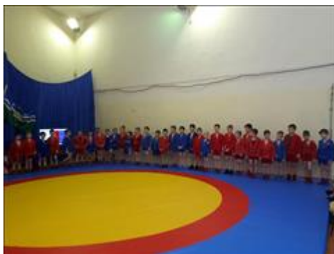
Участники второго дня соревнований Во втором дне приняли участие юные самбисты 2010-2011 г.р.