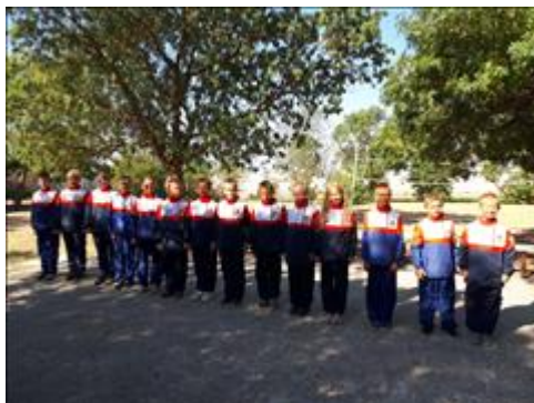
Парадная форма Построение в парадной форме в летнем спортивном лагере

Мероприятие: Организация и проведение соревнований по рекомендуемой Всероссийской федерацией самбо для юношей системе до 6 штрафных очков