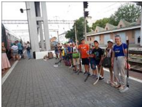
Добрались на поезде до Краснодара Фото 26.07.2020, едем на место проведения летнего спортивного лагеря